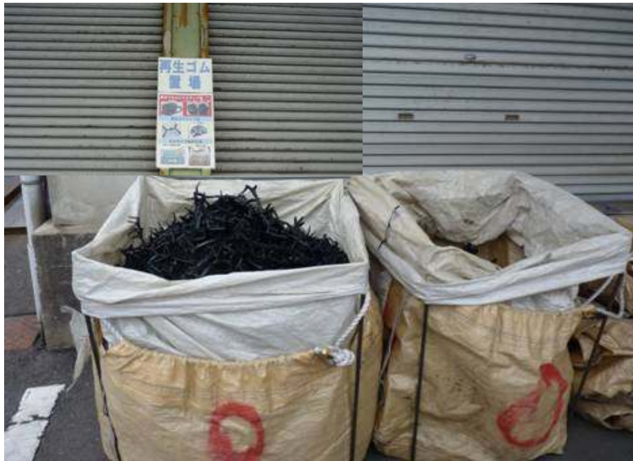
廃ゴムランナーの分別リサイクル