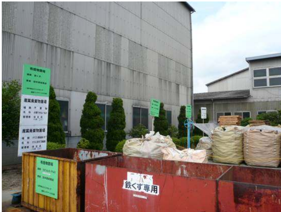
リサイクルできる有価物は緑看板で表示