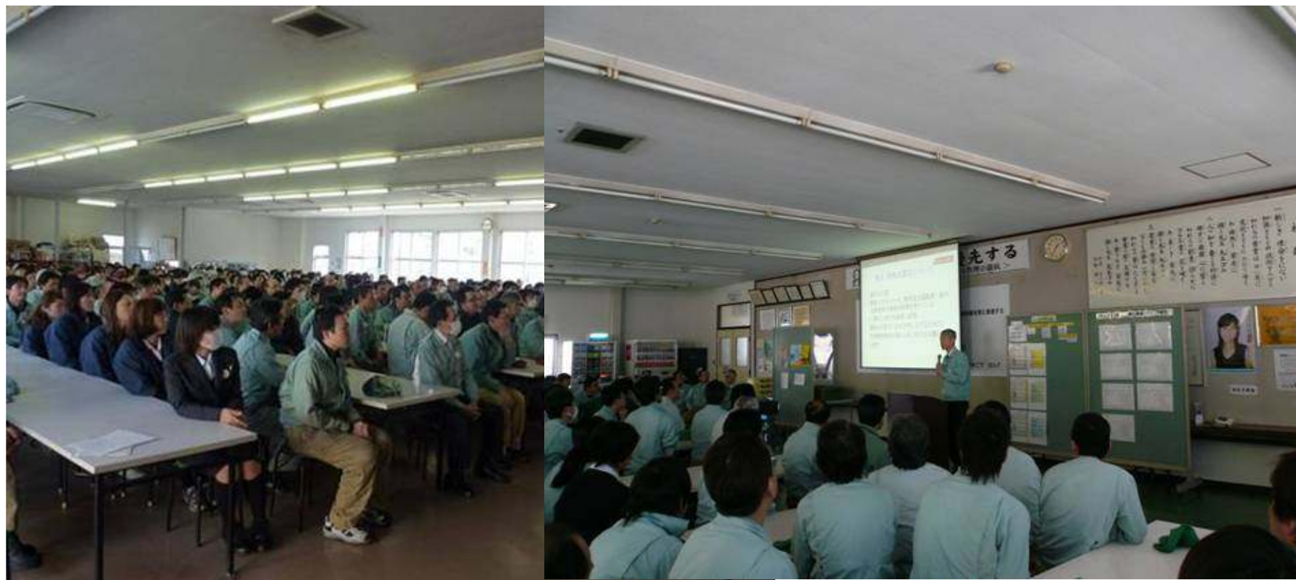
環境全員集会の様子