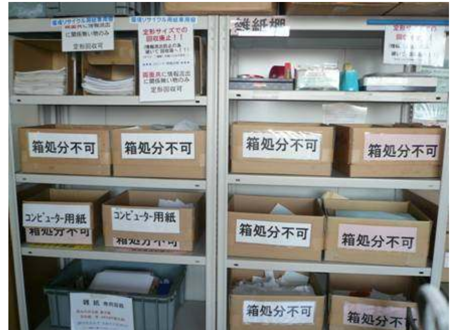
事務所での用紙リサイクル