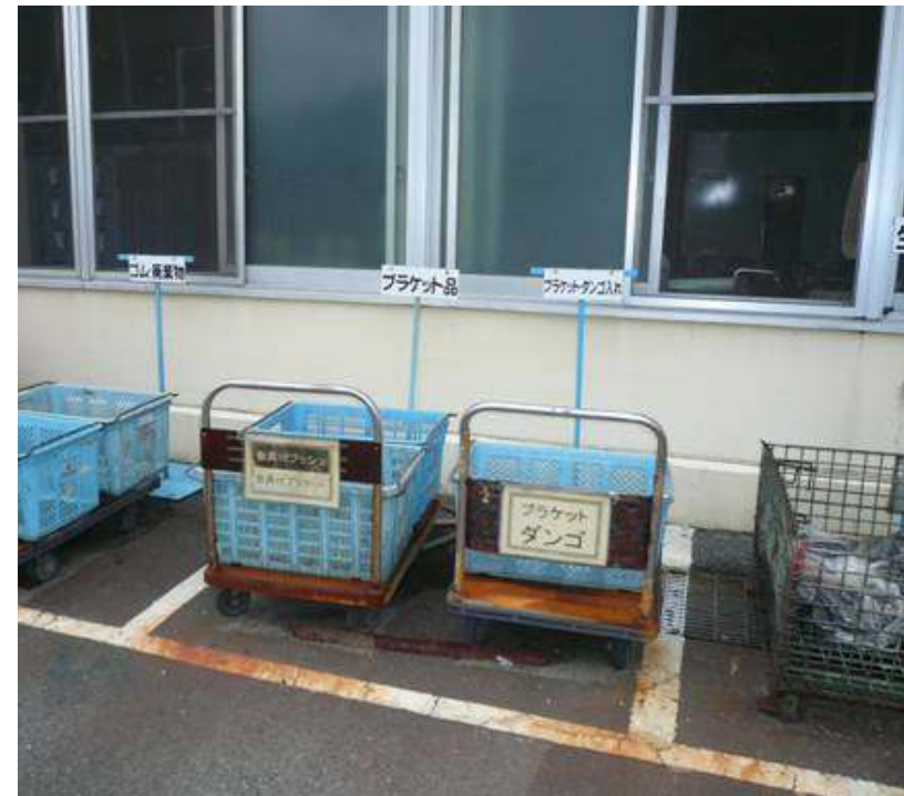
細かく分別し、リサイクル